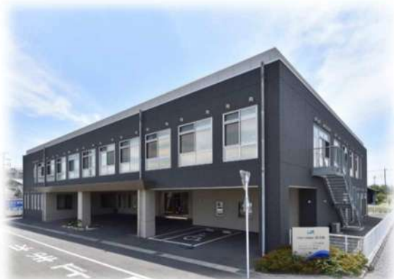
介護老人保健施設おうみ