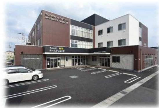
複合施設うしいけ